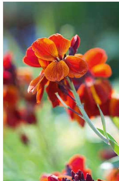
Erysimum 'Red Jep'

In juni gaat het tuinwerk onverminderd door. Ik moet echt dagen inplannen om te voorkomen dat het werk mij boven het hoofd groeit: de stroomversnelling die begin mei op gang kwam met de ontwikkeling van de vaste planten, lijkt een woest kolkende rivier te zijn geworden die pas tegen het eind van deze maand tot bedaren komt. Dat betekent iedere dag de tuin door gaan en in de gaten houden of er niet ergens iets ontspoord en of je op tijd kunt ingrijpen. Smyrniium perfoliatum is nu helemaal uitgebloeid en heeft zwarte zaadbolletjes gemaakt die geogst kunnen worden om andere liefhebbers van deze plant blij