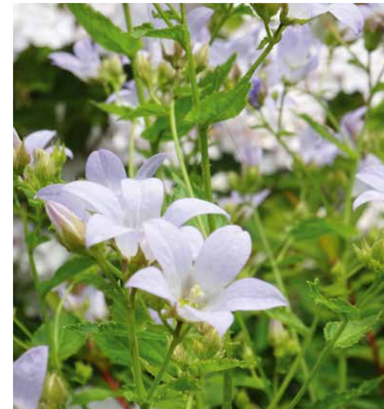
Campanula lactiflora 'Loddon Anna'