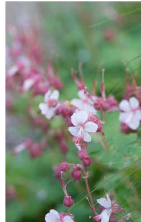
Geranium macrorrhizum 'Spessart'

Een van de verrassingen van deze maand is het verschijnen van de laatbloeiende bollen waarvan ik vergeten was dat ik ze geplant had. Zo kwam Ixia paniculata 'Eos' tevoorschijn in de rand van de ronde border, tussen de daar aanwezige Geranium macrorrhizum . Ik had me er iets anders bij voorgesteld want de bloemetjes die hier verschenen, waren wat vlekkerig en rommelig in plaats van de crèmegele sterretjes die ik voor ogen had. Misschien heeft de standplaats ermee te maken of is de concurrentie van omringende planten te groot waardoor ze zich niet optimaal kunnen ontwikkelen? Dus maar afwachten of ze het een volgend jaar beter doen en anders: jammer. Meer naar het midden van dezelfde border verschenen half juni het blad en de knoppen van Ornithogalum ponticum 'Sochi'. De knoppen groeiden uit tot lange, piramidale bloemtrossen met zuiverwitte bloemen, 60 cm hoog en dan ook nog eens meerdere bloemen per bol. Een fantastische aanwinst die zes weken bleef bloeien. Min of meer bij toeval stuitte ik in de border die tegen de kas aan ligt op de fijne bloemetjes van Triteleia , in wit en hemelsblauw, die zich dapper omhoog werkten tussen de omringende vaste planten. Het eerste jaar was de bloei nog wat mager, maar ze staan hier op een alleszins geschikte plek: in de zon, in de droogste border van de tuin en met een warme muur achter zich. Dat belooft wat voor de komende jaren.