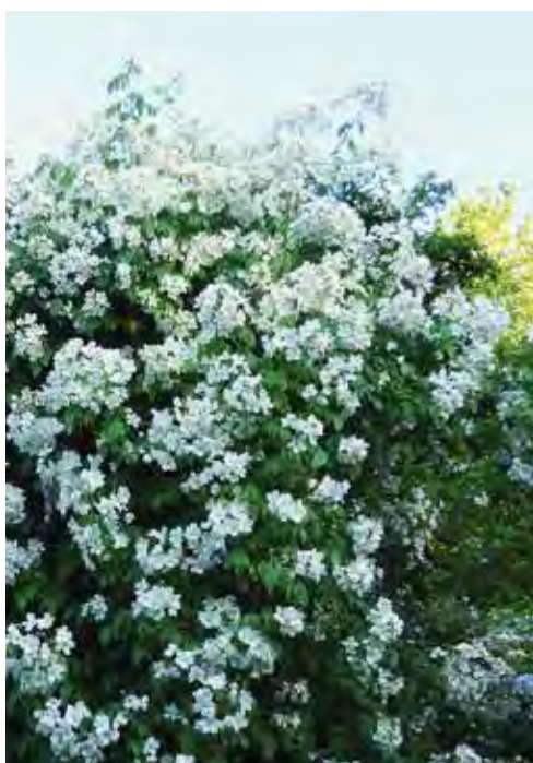
De niet te stuiten klimroos King Edward VII op zijn oorspronkelijke plek in Amsterdam en in mijn tuin in Weesp

daardoor werd het leed enigszins verzacht. Hoe ze hem uit de grond gekregen heeft is me nog steeds een raadsel. Maar de roos kwam bij mij aan met nog voldoende wortels en een paar flinke hoofdtakken. Bij de es waarnaast ik hem plantte, voelde hij zich niet prettig en dus verhuisde hij naar de dijk, als begeleiding van de trapleuning. Dat was ook geen succes, want de nieuwe scheuten werden zo lang dat je al snel niet meer zonder kleerscheuren de trap op kon. Dus moest ik hem nogmaals verplanten, waarbij hij in twee delen scheurde. Die plantte ik boven op de dijk, tegen de bramen aan en daar ging het uiteindelijk goed. De bramen gaven houvast en langzamerhand verdwenen ze onder een deken van rozen. Inmiddels is het zo ver dat de tentakels van de roos, over de bramen en over de meidoorns op de dijk heen, als lianen in mijn tuin hangen. Prachtig en indrukwekkend, maar wanneer houdt dit op?