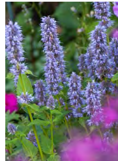
Agastache 'Blue Fortune'