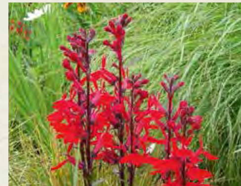
Lobelia speciosa 'Fan Red'