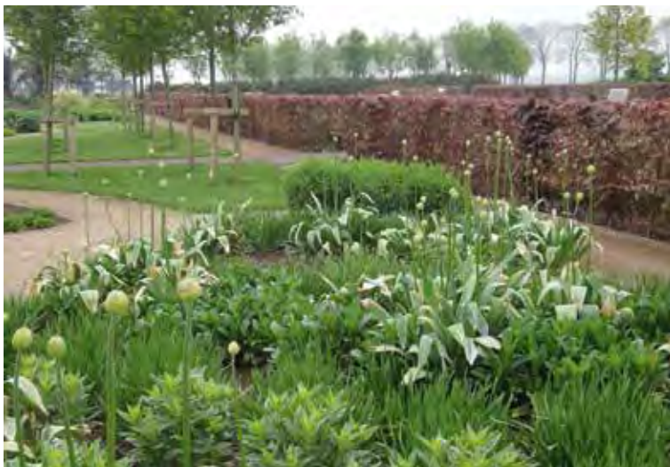
Begin en eind mei in de Tuinen van Appeltern