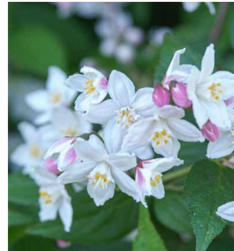
Bloemtros van de bruidsbloem ( Deutzia )