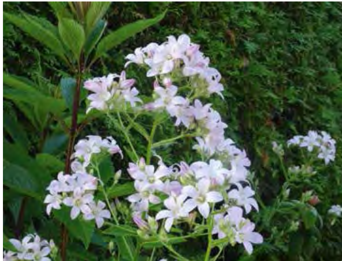
Campanula lactiflora 'Loddon Anna'

Bepaalde heesters ontkomen in deze maand ook niet aan een snoeibeurt. Een behoorlijk aantal heesters dat in het voorjaar bloeit, moet direct na de bloei gesnoeid worden omdat zij bloemen ontwikkelen op het hout van het vorige jaar. In mijn tuin staan seringens, Deutzia (bruidsbloem) en een boerenjasmijn waar ik in juni de takken die net gebloeid hebben uitknip, om het uitlopen van nieuwe takken die volgend jaar zullen bloeien te stimuleren.