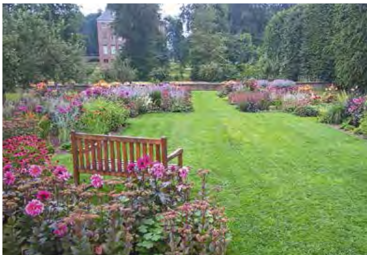
Zomer in de bloementuin van Kasteel Amerongen