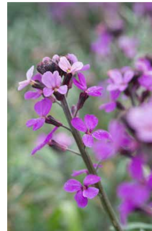
Erysimum 'Bowles' Mauve'

te maken. De overblijvende goudgele stengels laten zich gemakkelijk uittrekken, tegelijkertijd met het laatste vergelende blad van de voorjaarsbollen. Dan wordt ook het eerste hardnekkige onkruid zichtbaar, waaronder winde en zevenblad, en moet je er tijd aan besteden om dat te lijf te gaan.