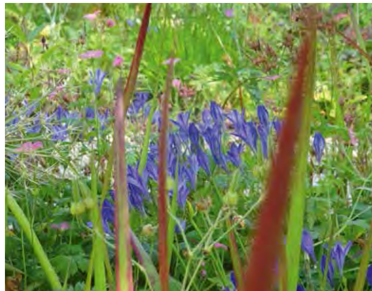
Triteleia laxa 'Koningin Fabiola'

minder wordende bloei: bollen die vijf jaar geleden in de buurt van een struik geplant zijn, komen op een gegeven moment in de schaduw van die groter wordende struik te staan en dat heeft zijn weerslag op hun bloeirijkheid. Juni is de perfecte tijd om ze omhoog te halen omdat je nu nog aan het vergeelde blad kunt zien waar ze staan. Voorzichtig oproeien dus en dan de klisters uit elkaar halen en de bollen apart van elkaar, in kleinere en grotere groepjes op plekken met meer licht herplanten. Het tweede bollenklusje van deze maand is het bestellen van nieuwe bollen voor het aankomend najaar. Wie vroeg bollen bestelt loopt niet het risico dat later in het seizoen allerlei soorten niet meer verkrijgbaar zijn. Maak nu even tijd om je aantekeningen van afgelopen voorjaar op te zoeken, een lijstje te maken en de bestelling op te geven. Dan ben je er in het najaar in ieder geval zeker van dat je krijgt wat je hebben wilt.