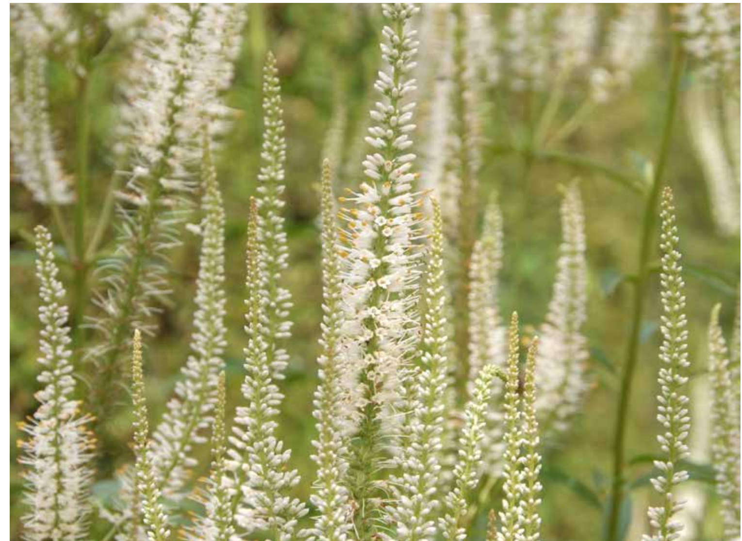
Veronicastrum virginicum 'Album'

Om nog even bij het onderwerp 'snoeien' te blijven: de parasolmeidoorns die op de overgang van de openbare tuin en onze privétuinen groeien, zijn in juni ook aan een snoeibeurt toe. Het bijknippen van deze boompjes is een klus die met enig beleid geklaard moet worden. Het betekent namelijk dat je moet manoeuvreren vanaf een hoge trap, die voorzichtig in de onderliggende borders geplaatst wordt. Ik waag mezelf met een elektrische heggenschaar niet meer op zo'n hoogte, maar gelukkig is de jongste zoon van onze burens, Toon, heel handig. Ik laat dit werkje graag aan hem over. Hij is ook degene die me helpt bij het snoeien van het groenblijvende ligusterboompje ( Ligustrum delava-