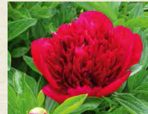
Paeonia 'Red Charm'