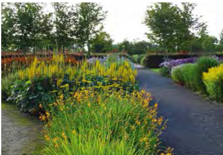
Juli en augustus in de Tuinen van Appeltern