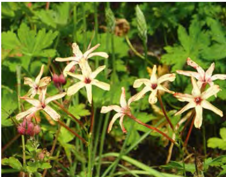
Ixia paniculata 'Eos'