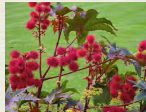
Ricinus communis 'Carmencita Red'