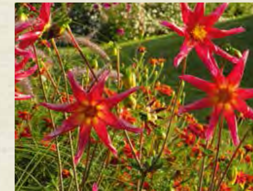
Dahlia 'Honka Surprise'