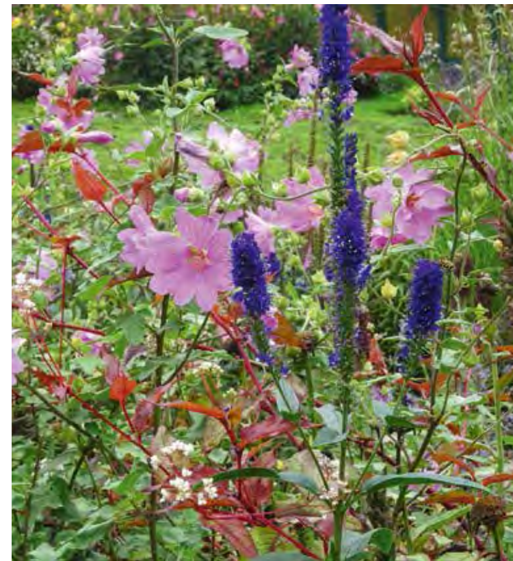
Veronica longifolia 'Marietta' met Lavatera olbia 'Rosea'

Niet alleen in mijn eigen tuin volg ik de ontwikkeling van de beplanting op de voet, maar ook van andere projecten waarvoor ik het beplantingsplan maakte. In 2008-2009 werkte ik aan beplantingsplannen voor de Nationale Vasteplantentuin in de Tuinen van Appeltern, die in 2010 werd geopend. Sindsdien ga ik ten minste één keer per jaar daarheen voor een controleronde, samen met de leverancier van de vaste planten en de tuinman die verantwoordelijk is voor het onderhoud van de tuin. Zo'n rondje is altijd heel leerzaam omdat je ziet hoe de planten zich ontwikkelen en waar bijsturing nodig is. Nu, enkele jaren later, blijken sommige borders aan vernieuwing toe te zijn. Omdat we deze alle drie in de afgelopen jaren gevolgd hebben, is aanpassing ervan een vrij gemakkelijke klus waarover we het snel eens zijn.