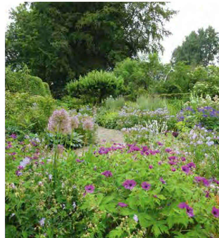
Paarsroze Geranium psilostemon met Allium 'Beau Regard' en zachtblauwe Geranium 'Mrs. Kendall Clark'