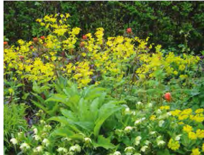
Smyrnium perfoliatum met Helleborus orientalis