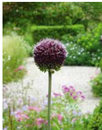
Allium amethystinum 'Forelock' Sierui

Dit is een van de vele sieruiensoorten. Op 40 cm hoge stengels verschijnen grote, doorzichtige ronde bloemen met een lila kleur. Verlangt volle zon en bloeit vanaf eind mei. Mooi als accent tussen net iets lagere of later in bloei komende vaste planten. Zet de bollen niet te dicht op elkaar; het is mooier als de bloemen elkaar niet raken als ze in bloei komen. Dit is een soort waar bijen dol op zijn. Als de bloemen zijn uitgebloeid, blijven de ingedroogde zaadbollen nog heel lang een interessant beeld geven.