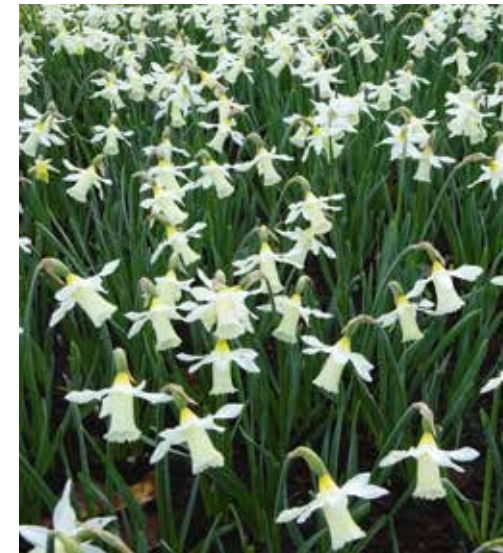
Narcissus 'Elka' Narcis

Deze narcis heeft duidelijk naar achteren wijzende dekblaadjes (zo heten de bloemblaadjes van narcissen) en een roomgeel trompetje, niet hoger dan 25-30 cm en bloeiend in april.