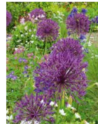
Allium 'Violet Beauty' Sierui

Deze Allium is eveneens fijnbloemig, tussen de 20 en 30 cm hoog, met lilaroze bloemetjes vanaf eind mei. Vermeerdert zich goed op een zonnige plek in liefst enigszins vochtige grond. Het is ook een goede snijbloem voor kleine boeketjes, bijvoorbeeld samen met juffertje-in-het-groen ( Nigella ). Heel anders, maar ook prachtig is de combinatie met dieppaarse bloemen van in dezelfde tijd bloeiende Geranium 'Rozanne' (ooievaarsbek) of Salvia nemorosa (salie).