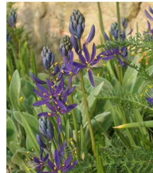
Camassia quamash Indianenbloem

Komt oorspronkelijk uit Noord-Amerika en heet daar 'indianenbloem' omdat de bollen door de indianen gegeten werden. Deze witte variant bloeit later dan alle blauwbloeiende Camassia's , rond eind mei. Rondom 1 meter hoge bloemstengels verschijnen dan stervormige, roomkleurige bloemetjes die samen een lange aar vormen. Indrukwekkend en langbloeiend! Voor enigszins vochtige grond en een zonnige plek. Ook na de bloei nog lang mooi met decoratieve zaadtoortsen.