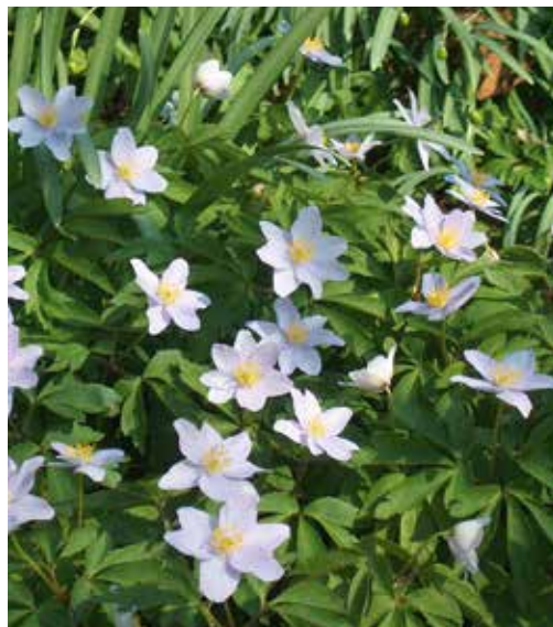
Anemone nemorosa 'Robinsoniana' Bosanemoon

Een vroege bloeier die op een warm plekje al in februari zijn blad laat zien. De bloei volgt in maart, met tot 10 cm hoge bloemetjes in verschillende blauwtinten. Het is een makkelijke groeier voor zowel zonnige als meer schaduwrijke plekken. Als ze het een keer ergens goed doen, zullen ze ieder jaar trouw terugkomen en zich langzamerhand uitbreiden. Naast deze blauwe zijn er ook varianten in stralend wit en in roze.