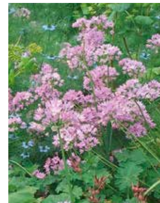
Allium unifolium Amerikaanse ui

Behoort tot de categorie 'fijnbloemige sieruien', want de bloemetjes zijn klein en staan op 30 cm hoge steel-tjes. Maar zeer de moeite waard, want eind mei begint de eerste bloei met witroze, papierachtige bloemetjes waarin ook al snel rode, glanzende besjes verschijnen. Dat zijn broedbolletjes die ervoor zorgen dat deze soort zich gestaag uitbreidt, mits in volle zon en op een niet al te vochtige plek. Allium roseum maakt weinig blad en is daardoor ook heel geschikt voor in een pot.