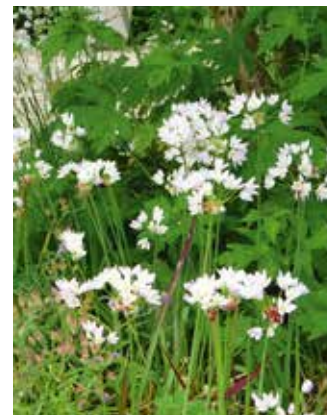
Allium roseum Sierui

Dit is een verwarrende naam want de bloem (een plat scherm met daarbovenop een halve bol) bloeit wit. Het zijn de zwarte zaaddozen die voor de naam 'zwarte look' zorgen. Een van mijn favorieten, want dit is een ijzersterke soort die zich goed vermeerderd en het ook in halfschaduw nog naar zijn zin heeft. De bloei begint half mei en houdt lang aan. Tijdens de bloei verwelkt het blad, maar dat kan gewoon weggeknipt worden. Op het moment namelijk dat de bloei begint is de nieuwe bol voor volgend jaar al uitgegroeid. Met zijn ongeveer 80 cm hoogte een indrukwekkende soort.