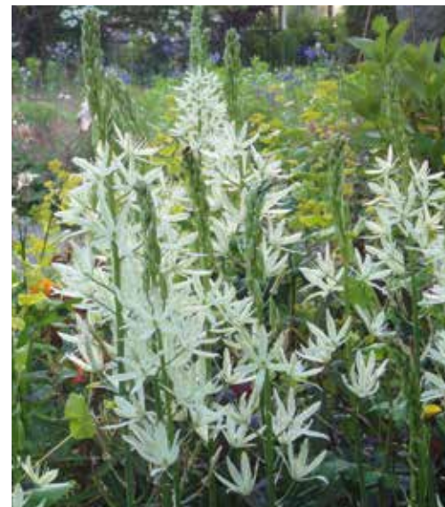
Camassia leichtlinii 'Alba' Indianenbloem

Familie van de wilde, witte bosanemoon, maar deze wordt veel hoger. Deze variëteit heeft heel lichtblauwe, naar grijsig neigende bloemen die het mooist tot hun recht komen op een beschaduwde plek, bijvoorbeeld onder bladverliezende heesters. De bloeitijd is maart-april en de maximale hoogte is 20 cm. Ook deze anemoon breidt zich langzaam uit tot grotere groepen.