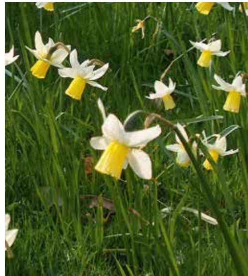
Narcissus 'Dove Wings' Narcis

Deze narcis heeft duidelijk naar achteren wijzende dekblaadjes (zo heten de bloemblaadjes van narcissen) en een roomgeel trompetje, niet hoger dan 25-30 cm en bloeiend in april.