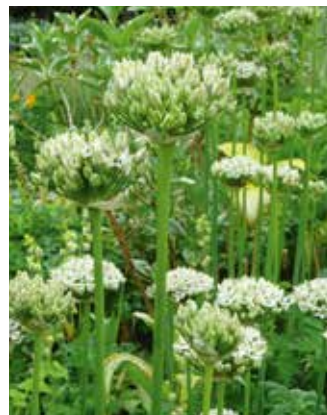
Allium nigrum Zwarte look

Valt op door zijn merkwaaardige bloemvorm: in het begin min of meer eivormig waarna zich een sprieterige kuif, zoals van een pauw, op het bovenste deel van de bloem ontwikkelt. De kleur is ook merkwaardig: eerst groenig, daarna purperrood met paars. Met een hoogte van ruim een meter is dit een echte liefhebberssoort. Je hebt er maar een stuk of zeven, acht van nodig om de border een bijzonder accent te geven. Een goede aanvulling van een pluk siergrassen, papavers of paarsbloeiende salie. Voor volle zon.