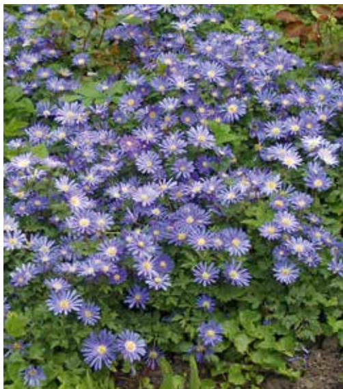
Anemone blanda 'Blue Shades' Voorjaarsanemoon of oosterse anemoon

Een vroege bloeier die op een warm plekje al in februari zijn blad laat zien. De bloei volgt in maart, met tot 10 cm hoge bloemetjes in verschillende blauwtinten. Het is een makkelijke groeier voor zowel zonnige als meer schaduwrijke plekken. Als ze het een keer ergens goed doen, zullen ze ieder jaar trouw terugkomen en zich langzamerhand uitbreiden. Naast deze blauwe zijn er ook varianten in stralend wit en in roze.