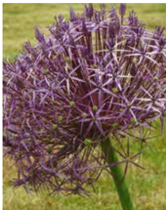
Allium christophii Sterrenlook

Dit is een van de vele sieruiensoorten. Op 40 cm hoge stengels verschijnen grote, doorzichtige ronde bloemen met een lila kleur. Verlangt volle zon en bloeit vanaf eind mei. Mooi als accent tussen net iets lagere of later in bloei komende vaste planten. Zet de bollen niet te dicht op elkaar; het is mooier als de bloemen elkaar niet raken als ze in bloei komen. Dit is een soort waar bijen dol op zijn. Als de bloemen zijn uitgebloeid, blijven de ingedroogde zaadbollen nog heel lang een interessant beeld geven.